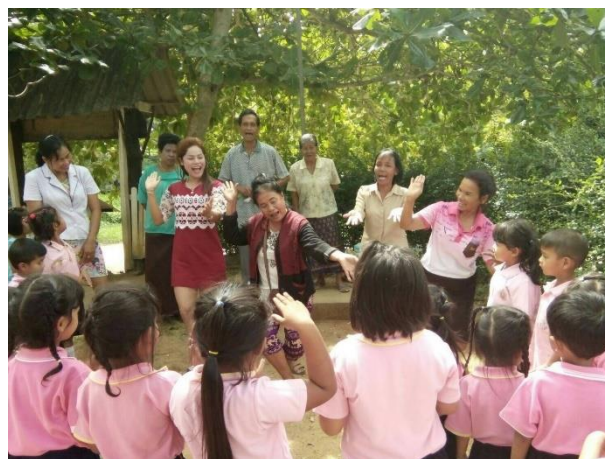
ภาพการสอนรำมโนราห์ ของครูหม่อมโนราห์ในพื้นที่องค์การบริหารส่วนตำบลตะกุกเหนือ