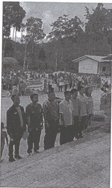
39. จัดการแข่งขันกีฬาศูนย์พัฒนาเด็กเล็ก งบประมาณ 21,245 บาท